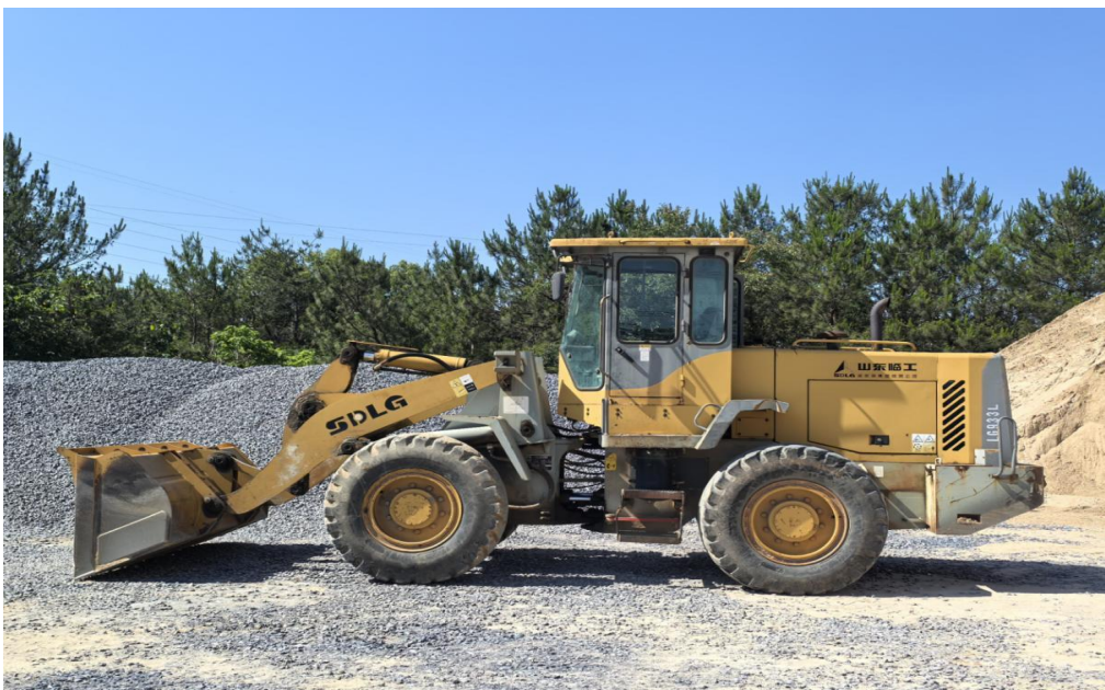
图 1 LG933L 轮式装载机

事故车辆是肇事司机于 2020 年购买的二手挖掘机（图 1），车辆类型：LG933L 轮式装载机；额定载重量：30000N；工作质量：10200kg；外形尺寸（长宽高）：6970X2510X3087mm；最高设计速度：40km/h。