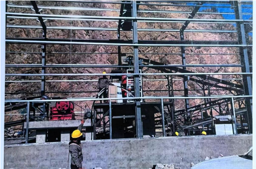
图 2 事发区域